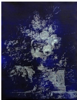
湯淺克俊, 《Death of beauty #5》, 2014, 65.5 x 50.5 cm ( Blanc Art, 澳門 )