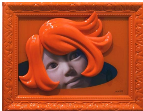
Kim MinKyung, 《Camouflaged selves》, 2016, 39 x 30 x 6 cm ( In and Out Art, 首爾 )