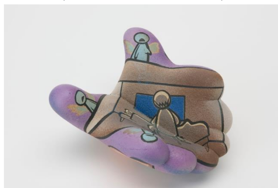
日野田崇, 三人の精霊, 2014, 9.5 x 16.5 x 18 cm ( 雲清藝術中心, 台灣 )