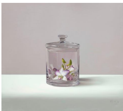
林文焰, 《海洋的贈品》2015, 26x25x25cm ( 青雲畫廊, 台灣 )