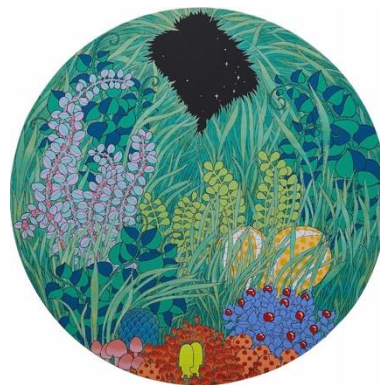
邓瑜, 《change the way you kiss me》, 2013, 60 x 60 m ( 如意畫廊, 廣州 )